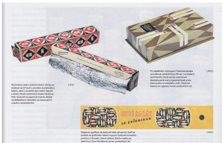
[471] Aluminový obal s bakteriocidními účinky se dodával na trh bač v plechovém (tunickém) balení, nebo v podobě osem metrů dlouhé a kolem třiceti centimetrů široké hliníkové fólie navinuté na papírové trubce. Alóbal ve skládáče s návodem na zasouvání užívá: Šedesátá léta.